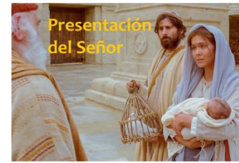
Presentación del Señor

La paz se hace cada día, en cada momento. ¿La sabemos ver? Ayúdanos a saber mirar, a saber escuchar. Señor, haznos descubrir los pequeños signos de paz. Señor, haznos portadores de Paz.