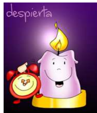
Vela y ora

Con este despertador, queremos simbolizar – Señor- nuestro deseo de estar con los cinco sentidos puestos en Tí. Haz que, en este tiempo de Adviento, nos espabilemos para orar, para dialogar contigo cada día y así preparar en profundidad tu llegada sin que otros intereses nos lo impidan.