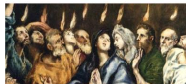
Recibid el Espiritu Santo