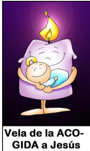
Vela de la ACOGIDA a Jesús