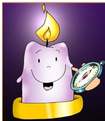
Vela de la alegría y del compartir

JESÚS: -«¿Qué salisteis a contemplar en el desierto, una caña sacudida por el viento? ¿O qué fuisteis a ver, un hombre vestido con lujo? Los que visten con lujo habitan en los palacios. Entonces, ¿a qué salisteis?, ¿a ver a un profeta? Sí, os digo, y más que profeta; él es de quien está escrito: "Yo envío mi mensajero delante de ti, para que prepare el camino ante ti." Os aseguro que no ha nacido de mujer uno más grande que Juan, el Bautista; aunque el más pequeño en el reino de los cielos es más grande que él.»