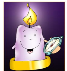
Vela de la alegría

Monitor: Bendigamos al Señor que nos quiere unidos y alegres. Que su paz y su alegría estén con todos vosotros... En la tercera semana de nuestro camino hacia la Navidad encenderemos tres cirios de la corona de Adviento: 1º la vela de la oración, 2º la vela de la conversión, el 3º la vela de la alegría. (Se enciende el cirio 3º mientras se dice esta oración).