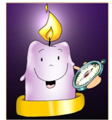
Vela de la alegría

Monitor: Bendigamos al Señor que nos quiere unidos y alegres. Que su paz y su alegría estén con todos vosotros... En la tercera semana de nuestro camino hacia la Navidad encenderemos tres cirios de la corona de Adviento: 1º la vela de la oración, 2º la vela de la conversión, el 3º la vela de la alegría. (Se enciende el cirio 3º mientras se dice esta oración).