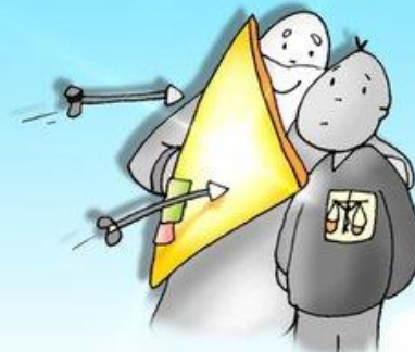
FELICES LOS PERSEGUIDOS DIOS SU REFUGIO