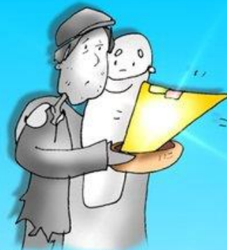
FELICES LOS POBRES DIOS SU RIQUEZA