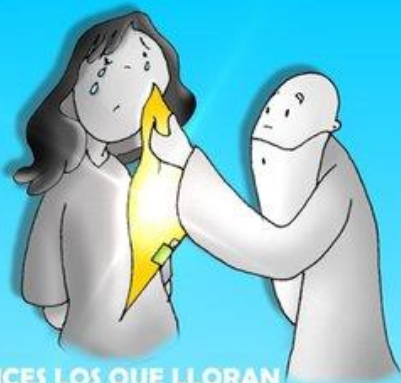
FELICES LOS QUE LLORAN DIOS SU CONSUELO