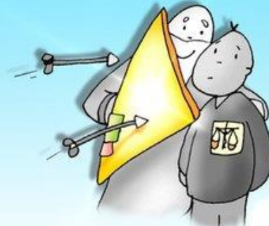
FELICES LOS PERSEGUIDOS DIOS SU REFUGIO