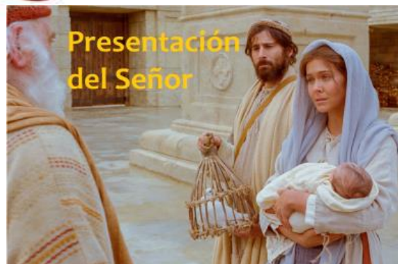
Presentación del Señor