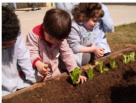
"HISTORIA DE UNA SEMILLA"