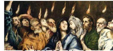
Recibid el Espiritu Santo