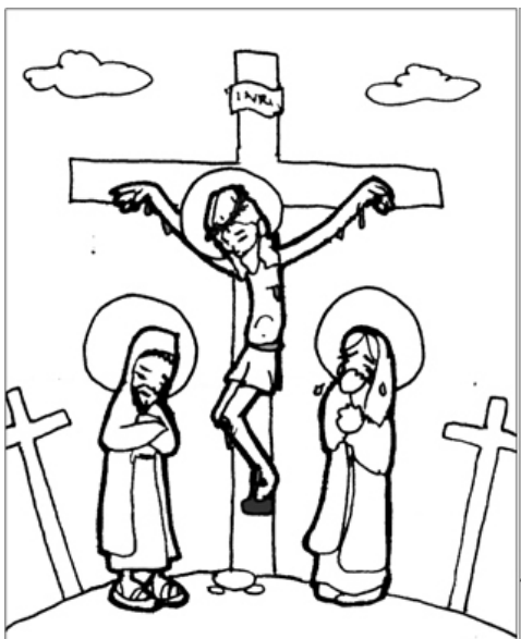
12º ESTACIÓN: JESÚS MUERE EN LA CRUZ