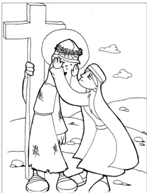
6º ESTACIÓN: LA VERÓNICA ENJUGA EL ROSTRO DE JESÚS