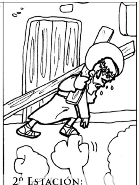
2º ESTACIÓN: JESÚS CARGA LA CRUZ