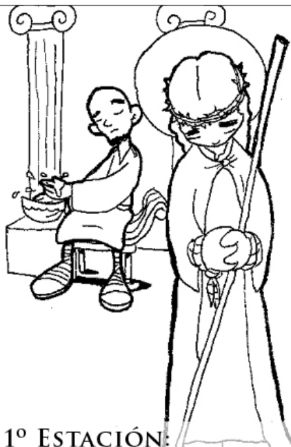
1º ESTACIÓN: JESÚS ES CONDENADO