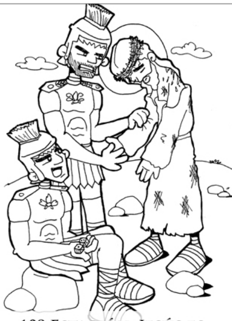
10º ESTACIÓN: JESÚS ES DESPOJADO DE SU ROPA