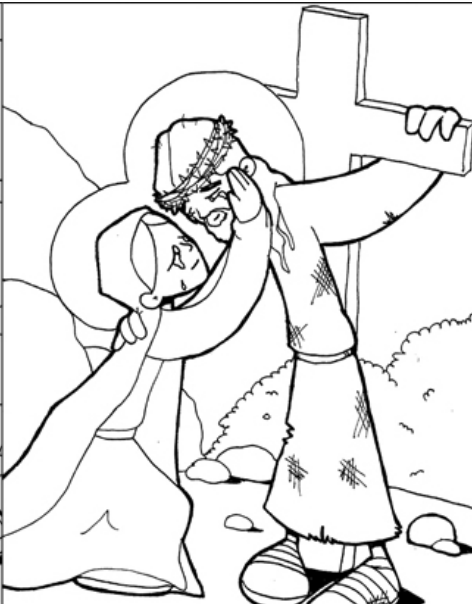
4º ESTACIÓN: JESÚS SE ENCUENTRA CON SU MADRE