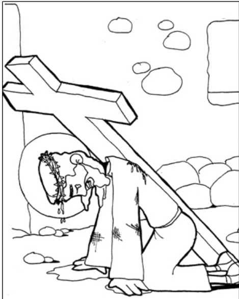
3º ESTACIÓN: JESÚS CAE POR PRIMERA VEZ