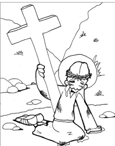
7º ESTACIÓN: JESÚS CAE POR SEGUNDA VEZ