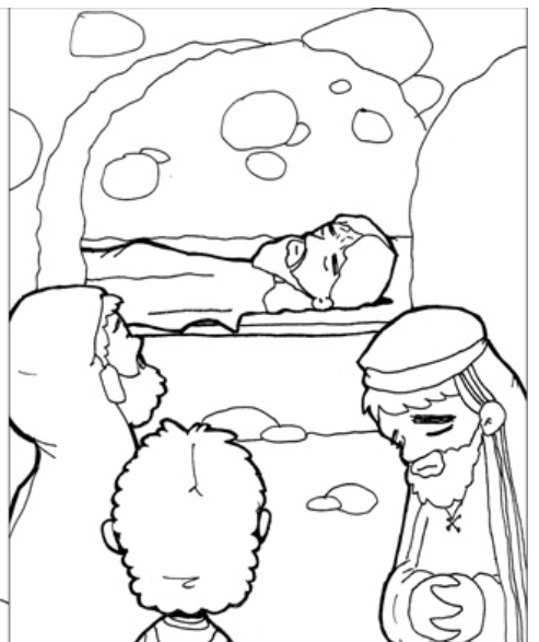
14º ESTACIÓN: JESÚS ES SEPULTADO