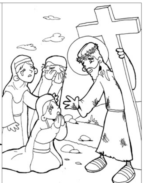
8º ESTACIÓN: JESÚS CONSUELA A LAS MUJERES DE JERUSALÉN