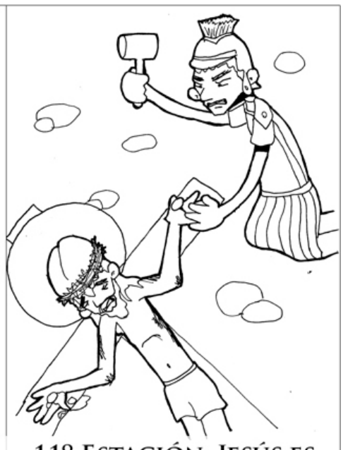
11º ESTACIÓN: JESÚS ES CLAVADO EN LA CRUZ