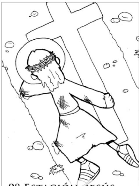
9º ESTACIÓN: JESÚS CAE POR TERCERA VEZ