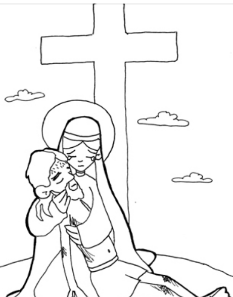
13º ESTACIÓN: JESÚS ES BAJADO DE LA CRUZ