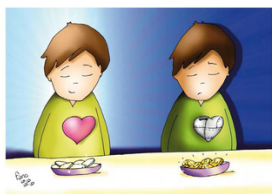
Dad a Dios lo que es de Dios

Después de escuchar el Evangelio podemos leer lo siguiente y profundizar en la Palabra de Dios.