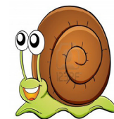
La 2ª letra