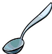
La 5ª letra