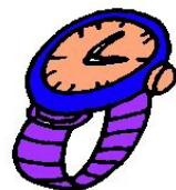
La 3ª letra