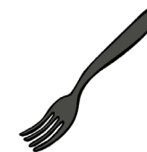
La 4ª letra