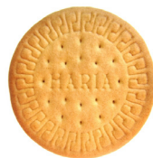
La 1ª letra

Escribe la palabra que corresponde a cada dibujo y con la letra indicada forma la palabra secreta. Esta palabra hace referencia a una región de Palestina situada al norte de Samaría, de la que la separaba el valle de Jezrael. Y es donde está hoy Jesús.