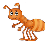
La 5ª letra